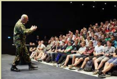
Ook een veelgevraagd spreker voor jeugdbijeenkomsten