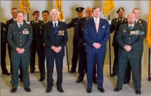
Met drie van de vier Ridders Militaire Willems-Orde bij Koning Willem-Alexander