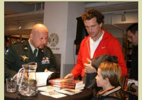
Tijdens één van zijn vele signeersessies