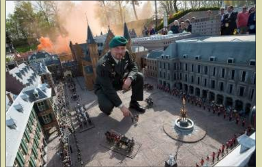
Plaatsing van een miniatuurversie van zichzelf op het Binnenhof van Madurodam