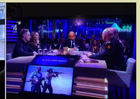
Een TV interview bij RTL Late Night van Humberto Tan