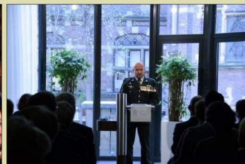
Uitgenodigd voor houden van herdenkingsrede op 4 mei bij Perscentrum Nieuwspoor