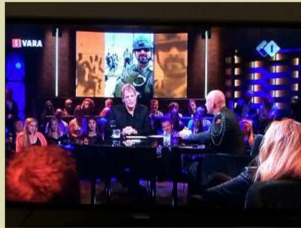
Een TV interview bij Pauw