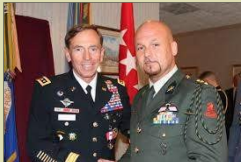
Een vriendschappelijke ontmoeting met de Amerikaanse 4**** generaal Petraeus