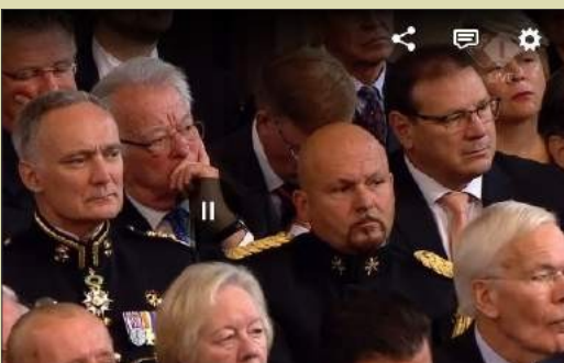
Luisterend naar de Troonrede op Prinsjesdag