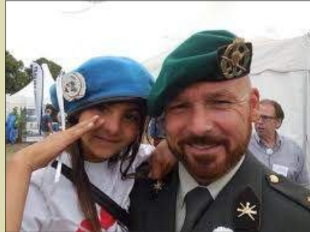
Tijdens de landelijke Veteranendag in Den Haag